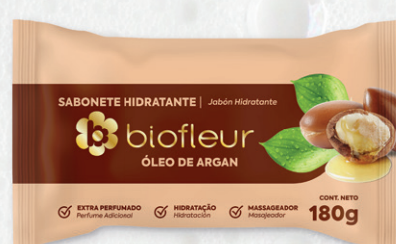
ÓLEO DE ARGAN