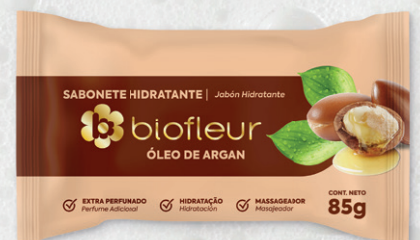
ÓLEO DE ARGAN 85G