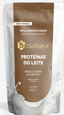
PROTEÍNAS DO LEITE