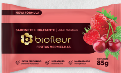
FRUTAS VERMELHAS 85G