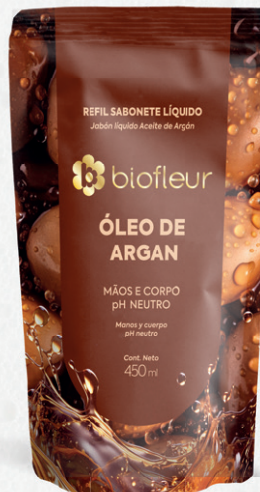
ÓLEO DE ARGAN