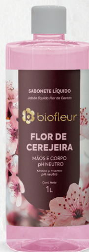
FLOR DE CEREJEIRA