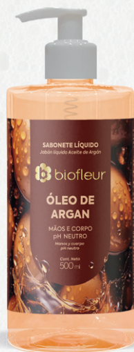
ÓLEO DE ARGAN