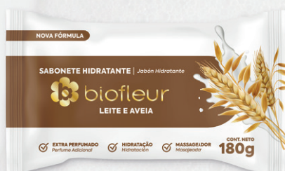
LEITE E AVEIA