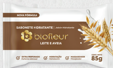
LEITE E AVEIA 85G