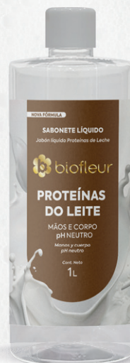
PROTEÍNAS DO LEITE