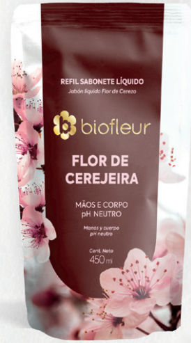
FLOR DE CEREJEIRA