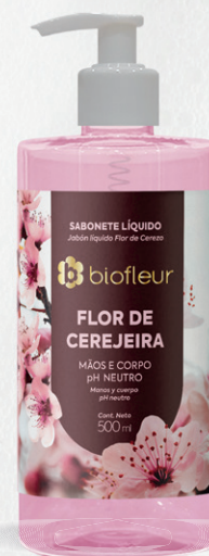
FLOR DE CEREJEIRA