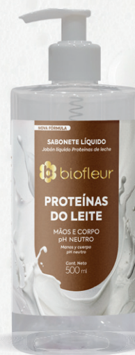
PROTEÍNAS DO LEITE